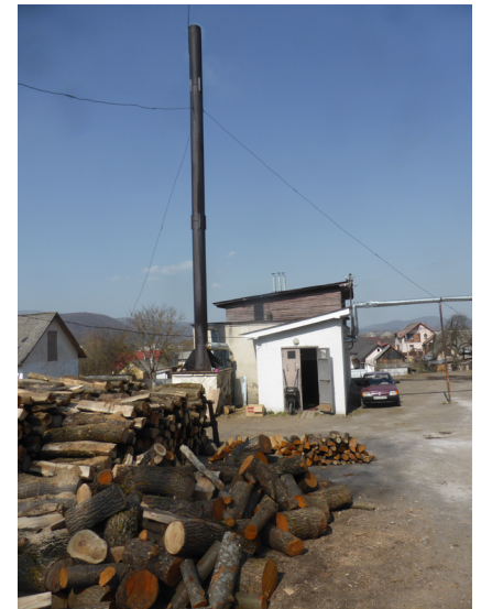
Die Holzheizung bringt genügend Wärme

ist grauenhaft. Alle Zimmer sind voll mit Lagern, vielfach eins direkt neben dem anderen, und häufig nicht einmal eine Matratze darunter. Es sind Menschen jeden Alters, die in Mariupol, Mikolajew, Charkiv, Kiew teilweise wochenlang in Kellern und U-Bahnschächten verbrachten und deren Wohnungen inzwischen von Raketen zerstört sind. Sie stehen vor den Trümmern ihrer Existenz, die sie sich in den letzten Jahren mühsam aufgebaut haben. Sie haben einfach Angst. Viele bleiben lieber in der Geborgenheit der stickigen, vollbelegten Räume als dass sie wenigstens in den Garten hinausgehen würden.