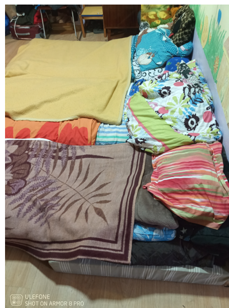
kein Millimeter bleibt zwischen den Lagern