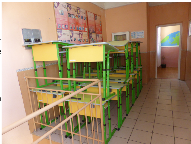
Die neuen Schulmöbel müssen noch warten, bis wieder Platz für die Schulkinder ist.

A handwritten signature in black ink, appearing to read 'Mike Schanz'.