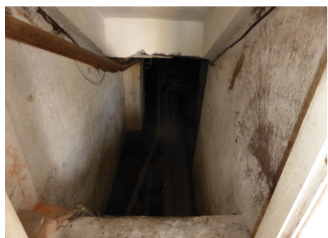
Abstieg in den nassen „Podval) Keller, der als Schutzraum dient