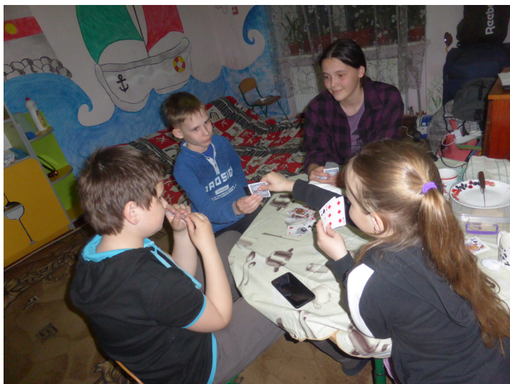
Die Kinder haben sich angefreundet und spielen Karten

Konto Bayerische Ostgesellschaft: IBAN DE14 7015 0000 0908 2302 20, sskm