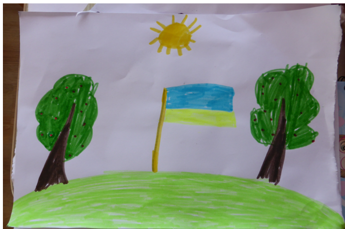
Hoffnung: gezeichnet von einem Kind In einer Flüchtlingsunterkunft in Peretschin

Unsere monatlichen Jours fixes mit ihren Vortragsveranstaltungen finden vorbehaltlich Corona Restriktionen an jedem 3. Montag im Monat im Haus des Deutschen Ostens, am Lilienberg 5, S-Bahn Rosenheimer Platz, gegenüber Gasteig,