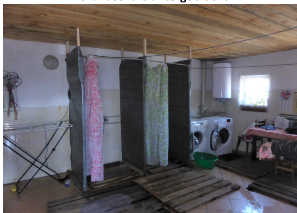
Mit Ihren Spenden konnten zwei provisorische Duschen und ein Boiler installiert werden und 2 Waschmaschinen