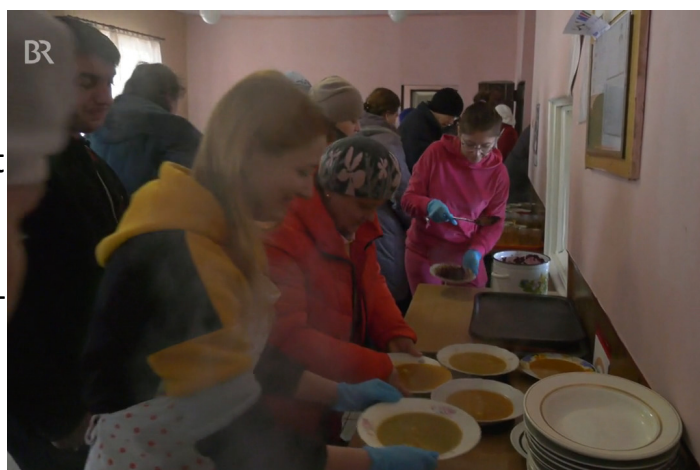
alle sollen wenigstens satt werden