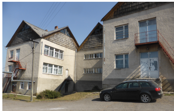
140 Flüchtlinge sind in diesem Kindergarten mit Grundschule untergebracht

Wir sind sehr erschüttert, welches Leid wir in den acht von uns betreuten Flüchtlingsunterkünften in den Kindergärten von Peretschin erlebten. Die BetreuerInnen bemühen sich außerordentlich, um eine irgendwie angenehme Atmosphäre für die Flüchtlinge zu schaffen, aber alleine die Platzsituation